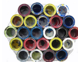
Microcosm 1, 2010

Seine Mikrokosmen sind kleinste und größere Objekte die demselben Gedanken folgen. Hierfür verwendet er, einerseits, die Deckel der Lackdosen. Er reibt sie aneinander oder lässt verschiedene Farben drübertropfen. Nachdem sie getrocknet sind, klebt er sie auf schwarz lackierte Mini-Leinwände. So entsteht auf jeder Leinwand ein Mikrokosmos in dem sich eine Mikrogalaxie befindet. Zum anderen entstehen größere Objekte aus aneinander gebundenen Lackdosen, die er außen bunt lackiert. Im Inneren jeder Lackdose befindet sich eine Mikrogalaxie. Zusammengebunden ergibt jedes Objekt einen Mikrokosmos.