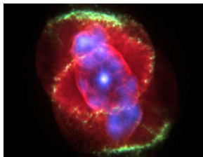
Fotografie des Hubble-Teleskops

Die Bilder der Werksreihe „Galaxies Of Color“ sind inspiriert von Fotografien des Hubble-Weltraumteleskops. Diese Fotografien zeigen ferne Galaxien, die in ihrer Entwicklungs-