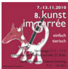
Flyer zur 8. kunst im carée

Die Werksreihe „The Funny Zoo“ entstand im Jahr 2010 für die 8. kunst im carée in Köln/Sülz. Dort bietet die Interessengemeinschaft Sülz/Klettenberg Carée e.V. jährlich Künstlern aus der Region eine Plattform, um ihre Kunst zu präsentieren. Jährlich schaffen die Ladeninhaber Raum für kleine und große Kunstwerke. Aufgrund des 150. Geburtstags des Kölner Zoos, fand die Veranstaltung in diesem Jahr unter der Schirmherrschaft des Kölner Zoo direktors statt. Das Thema lautete daher diese Jahr „einfach tierisch“.